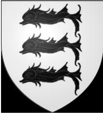
Armes de Nicolas Bouchart