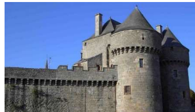
Rappel des premiers en-tête

Trois lettres informaient les adhérents chaque année. A partir de 2008, ce bulletin devint trimestriel. La pandémie de fin 2019 a rapidement mis en évidence le besoin de renforcer les liens amicaux, faute de pouvoir se réunir. C'est ainsi qu'en 2020 et 2021 parurent respectivement 10 et 12 lettres. Le rythme est redevenu normal maintenant. La diffusion est assurée essentiellement par courriel, mais quelques exemplaires papier sont adressés par courrier traditionnel ou sont laissés à disposition à la permanence.