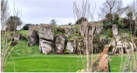
Rochers de Cramagué