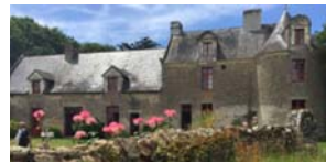
Manoir de Crémeur

La légende la plus tenace concerne bien sûr ce présumé réseau de souterrains existant sous la ville et se prolongeant jusqu'à Crémeur, ou Cardinal.... Ils sont souvent plein d'or et habités par des êtres fantastiques. Le sous-sol granitique rend difficilement réalisable ces ouvrages souterrains.