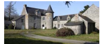
Manoir de Cardinal

Et puis, la mer ne venait-elle pas lécher les rochers de Cramagué, au sud du faubourg Saint-Armel, rochers qui culminent à une hauteur de 30 mètres ... laissant planer un sérieux doute sur une telle montée des eaux.