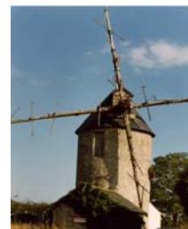
Moulin de Beaulieu

Venez vous joindre aux milliers de participants qui festoient et s'émerveillent le temps de ce week-end hors du temps avec pour thème « Sur les routes de l'or blanc »