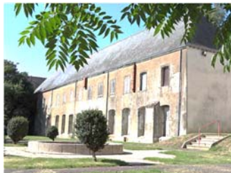
Couvent des Cordeliers