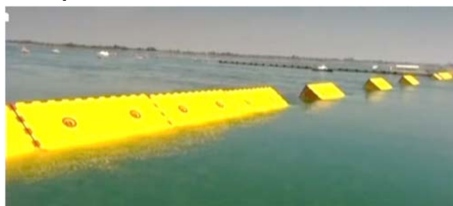
Digue anti-inondation comme à Venise ?